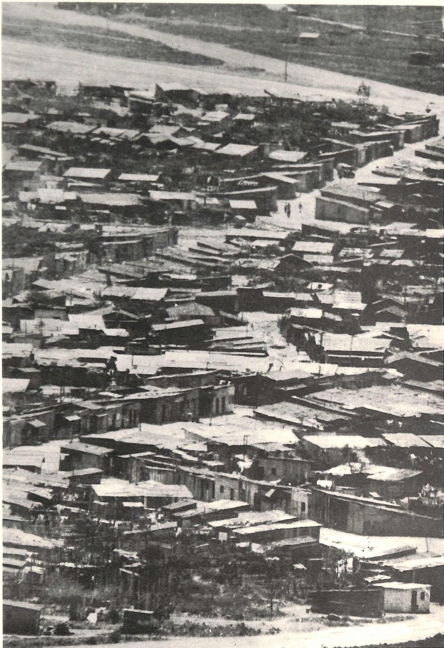
Fotografia/planejamento gráfico: João Xavier Coordenação/seleção de textos: Borba Sette