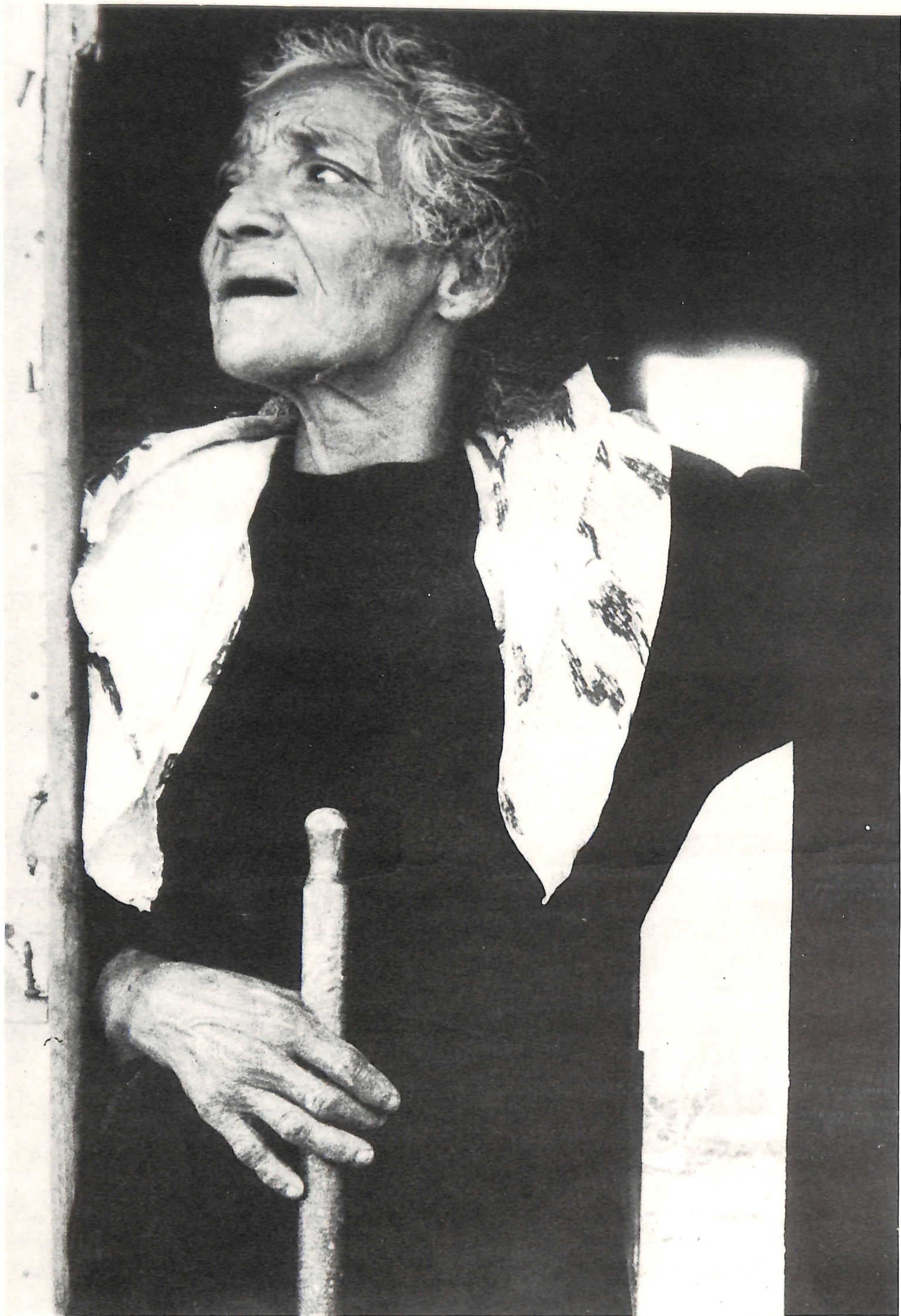
Fotografia/planejamento gráfico: João Xavier Coordenação/seleção de textos: Borba Sette