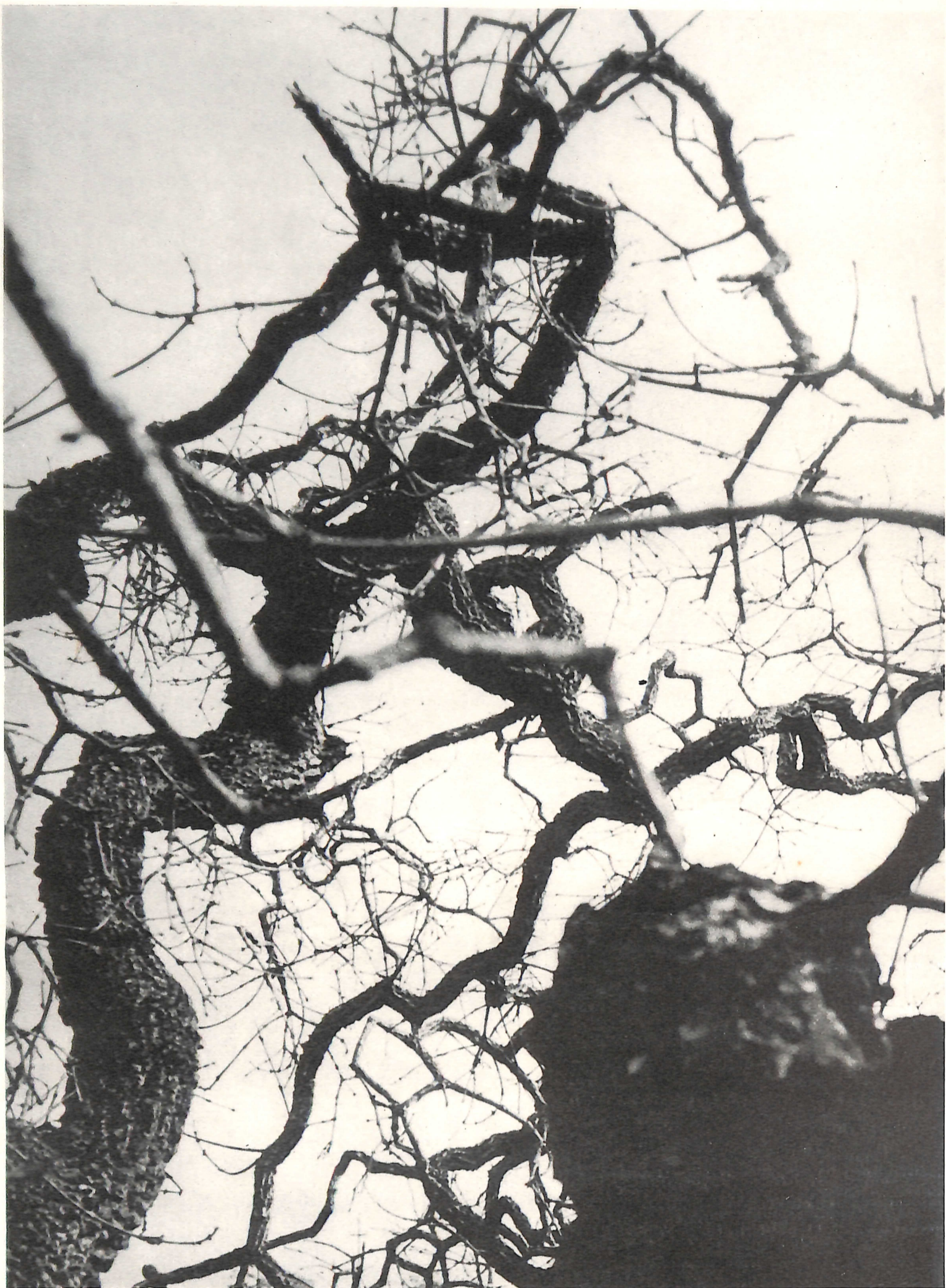
Fotografia/planejamento gráfico: João Xavier Coordenação/seleção de textos: Borba Sette

Êste campo, vasto e cinzento, não tem começo nem fim, nem de leve desconfia das coisas que vão em mim.