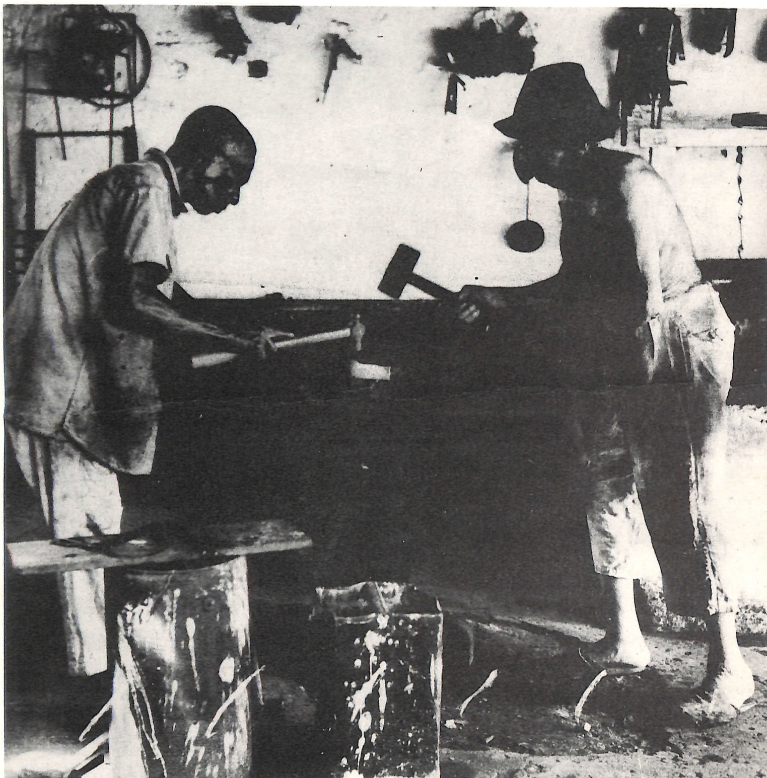
Fotografia/planejamento gráfico: João Xavier Coordenação/seleção de textos: Borba Sette

..... você faz alguém aproveita o chão o muro a casa a prole eles só no mole você faz e eles engolem.