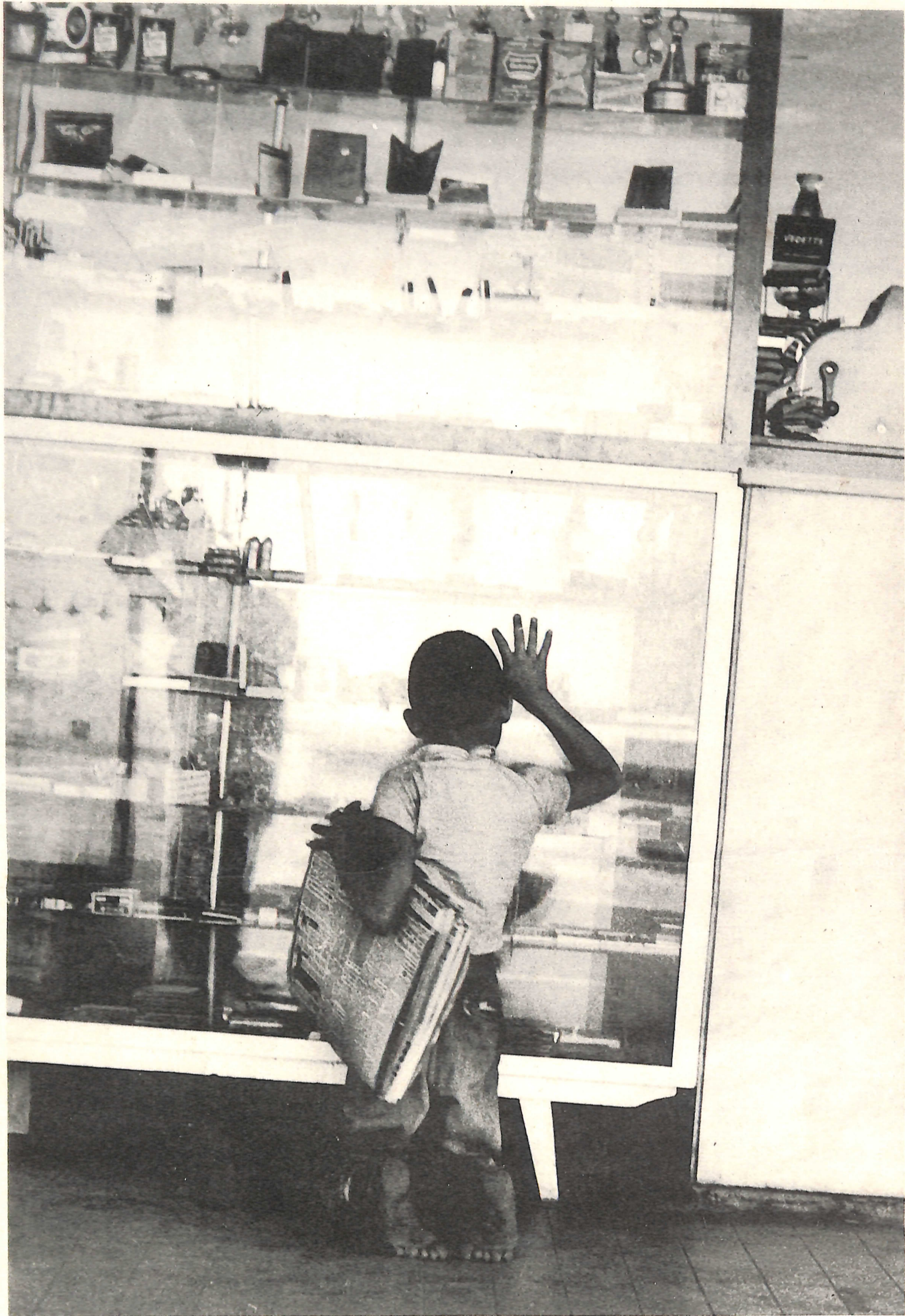
Fotografia/planejamento gráfico: João Xavier Coordenação/seleção de textos: Borba Sette

..... E ao bater vai batendo em cada porta que bate, bate a fome desse menino na pedra de tantas faces.