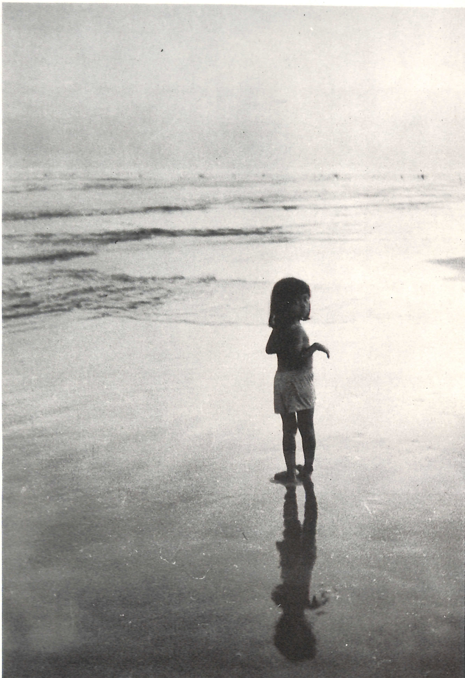
Fotografia/planejamento gráfico: João Xavier Coordenação/seleção de textos: Borba Sette

Não faz mal que amanheça devagar, as flôres não têm pressa nem os frutos: sabem que a vagareza dos minutos adoça mais o outono por chegar. Portanto não faz mal que devagar o dia vença a noite em seus redutos de leste-o que nos cabe é ter enxutos os olhos e a intenção de madrugar.