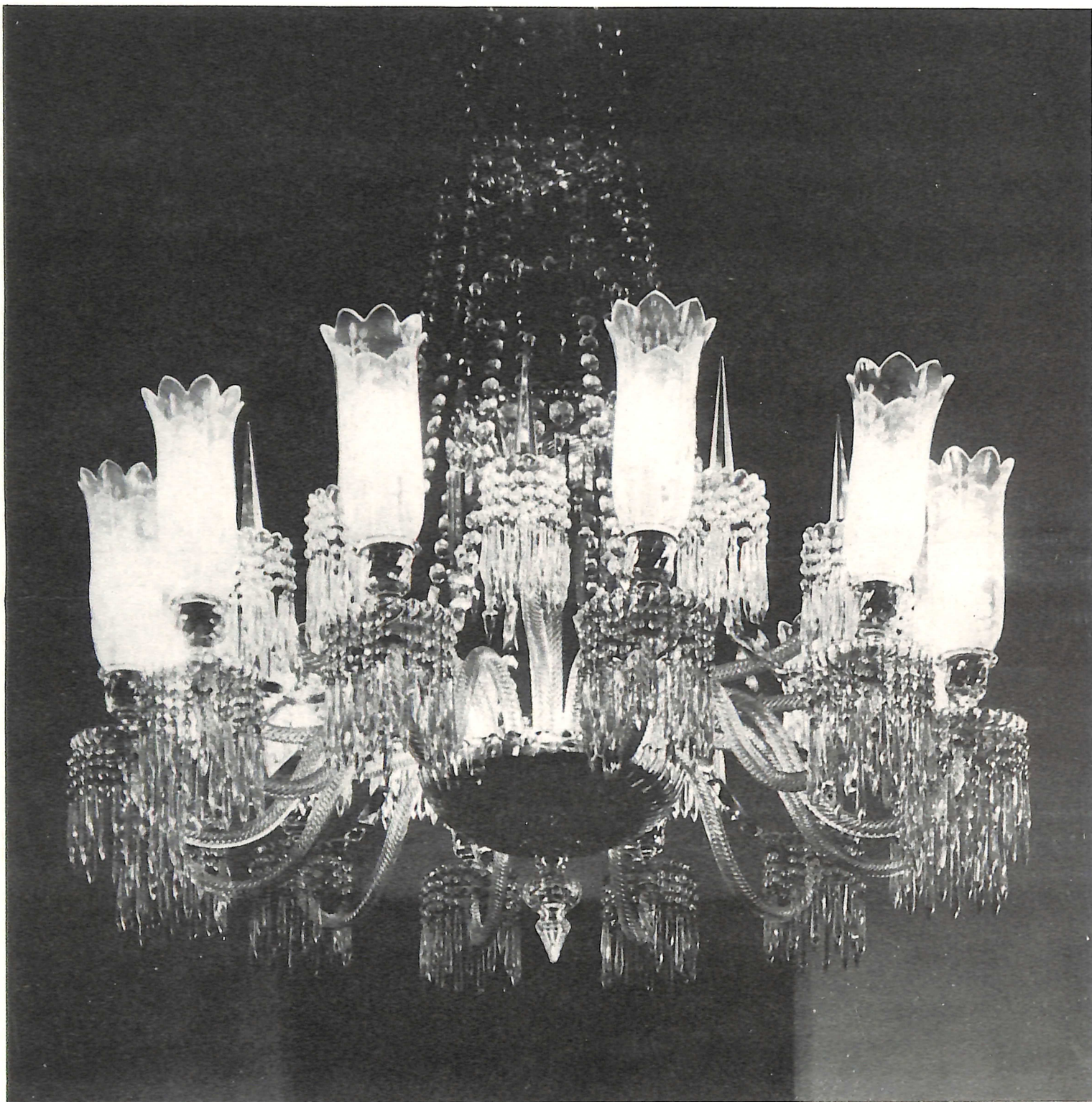
Fotografia/planejamento gráfico: João Xavier Coordenação/seleção de textos: Borba Sette

Senhores Donos da Terra juntai vossa rica tralha vosso cristal, vossa prata luzindo em vossa toalha. Juntai vossos ricos trapos Senhores Donos de terra que os nossos pobres farrapos nossa juta e nossa palha vêm vindo pelo caminho para manchar vosso linho com o barro da nossa guerra e a nossa guerra não falha!