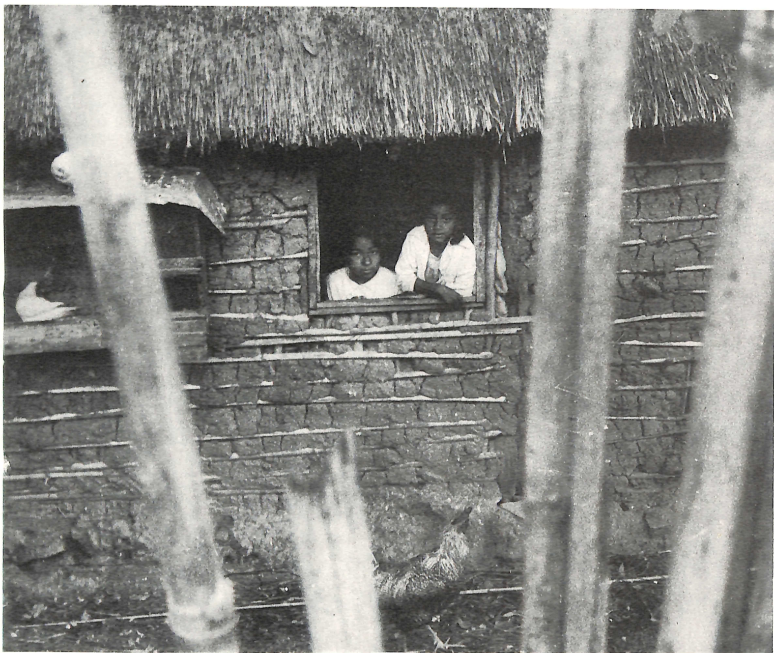
Fotografia/planejamento gráfico: João Xavier Coordenação/seleção de textos: Borba Sette