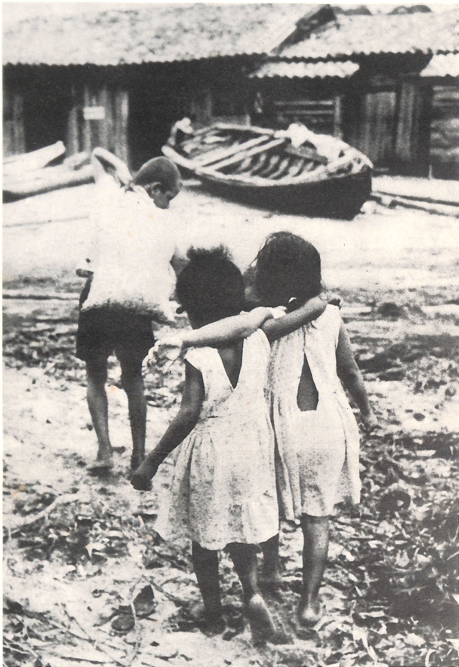
Fotografia/planejamento gráfico: João Xavier Coordenação/seleção de textos: Borba Sette