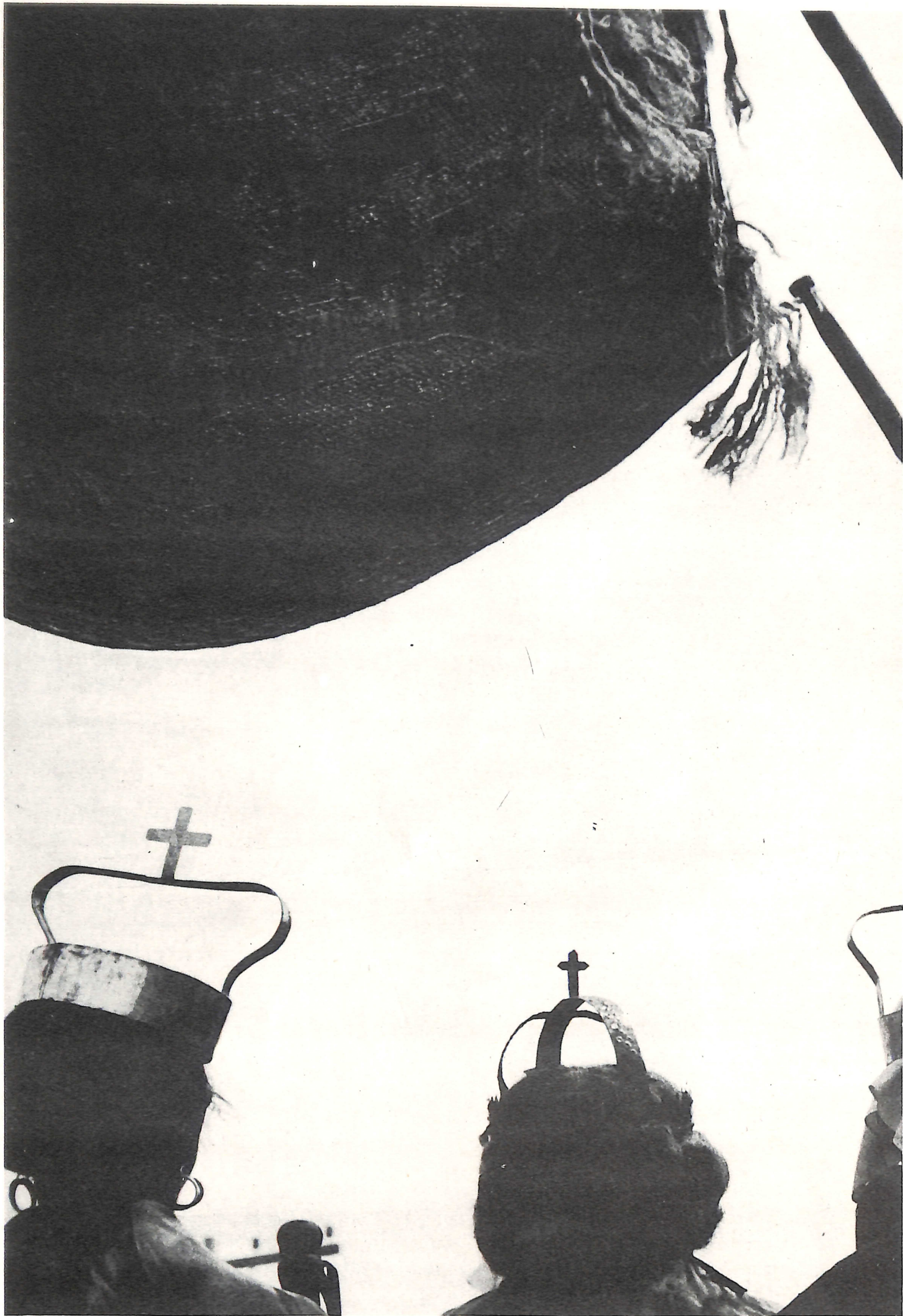
Fotografia/planejamento gráfico: João Xavier Coordenação/seleção de textos: Borba Sette

Enganado nos comícios, com promessas de armistícios a seus velhos sacrifícios, o povo não morrerá. Com a corda no pescoço tendo por jantar o osso que sobrou de seu almoço sei que o povo viverá.