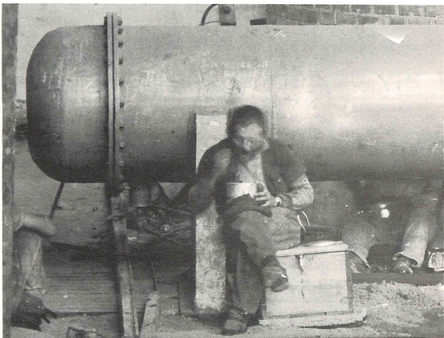
Coordenação/seleção de textos: Borba Setto

..... E aprendeu a notar coisas a que não dava atenção: notou que sua marmitta era o prato do patrão, que a sua cerveja preta era o uísque do patrão, que seu macacão zuarte era o terno do patrão, que o casebre onde morava era a mansão do patrão, que seus dois pés andarilhos eram as rodas do patrão, que a dureza do seu dia era a noite do patrão, que sua imensa fadiga era a amiga do patrão.